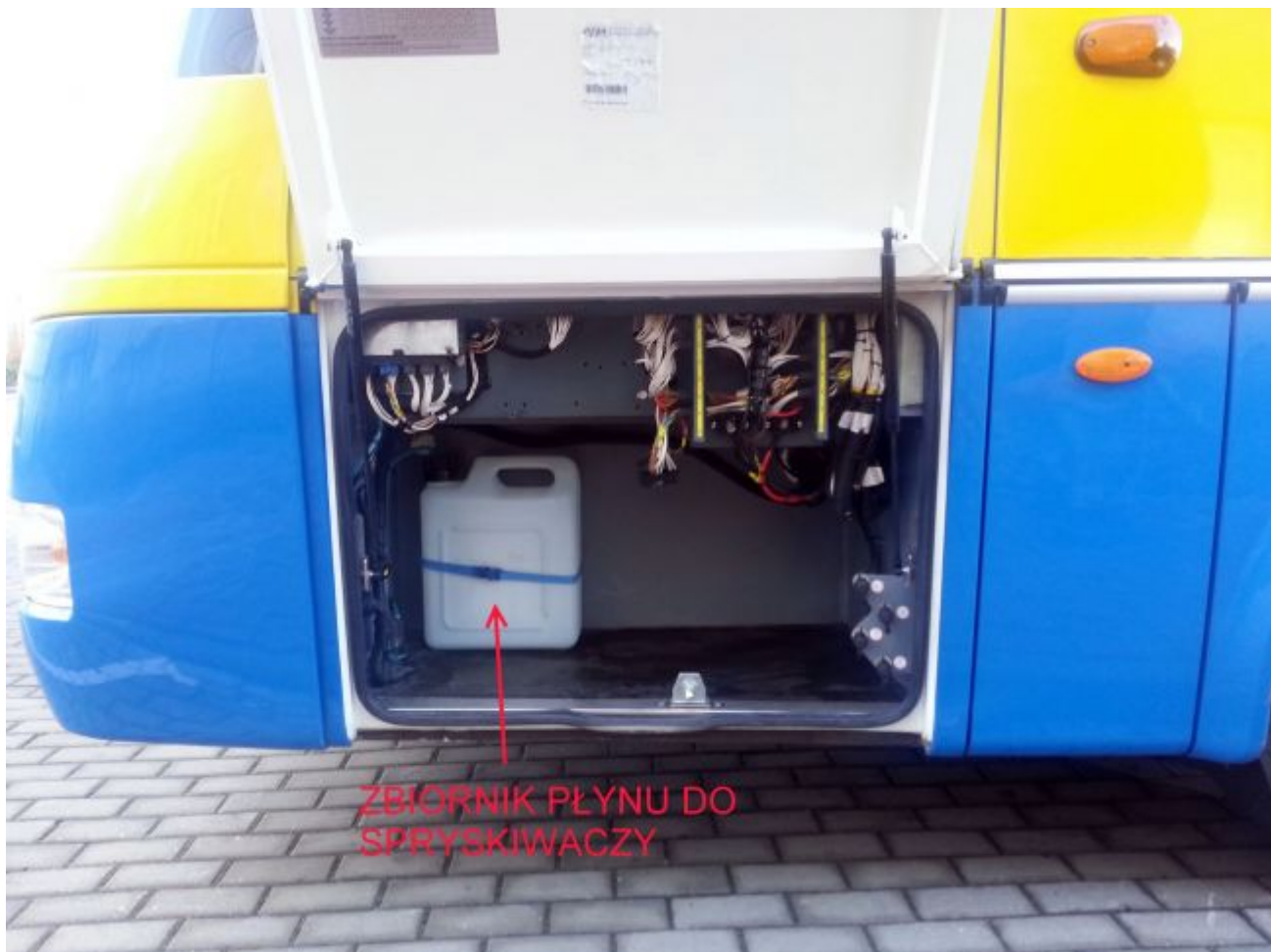
ZBIORNIK PŁYNU DO SPRYSKIWACZY